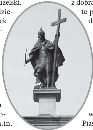
Zygmunt III Waza