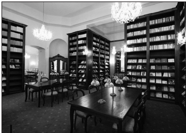
Czytelnia w której pracowała Olga Dąbrowska-Chwieroś