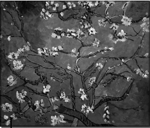
Kwitnący migdałowiec (1890). Vincent van Gogh.