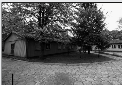
"Domek Szwedzki" przy ul. Wołodyjowskiego - dziś jest tu administracja USK.