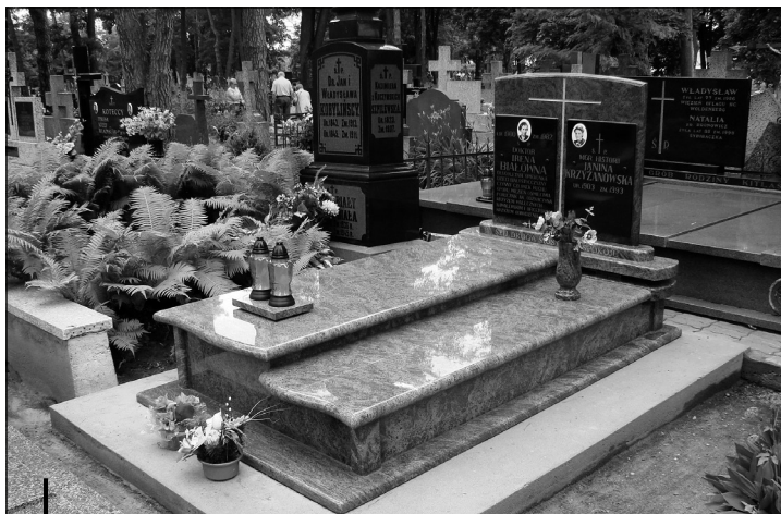
Grób lekarki na Cmentarzu Farnym w Białymstoku.

Dr n. med., adiunkt Zakładu Anatomii Prawidłowej Człowieka UMB.