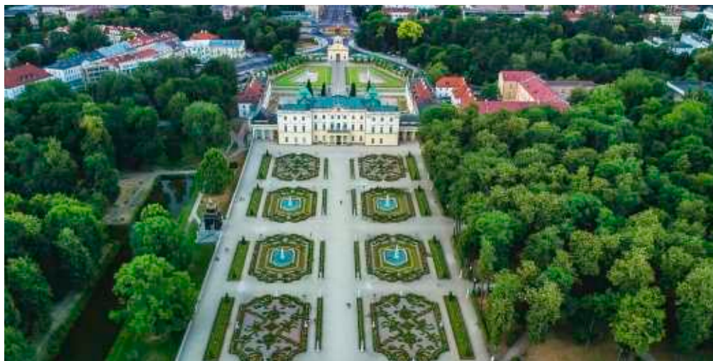
Pałac Branickich z drona

Czekamy na Wasz potencjał, kreatywność i energię!